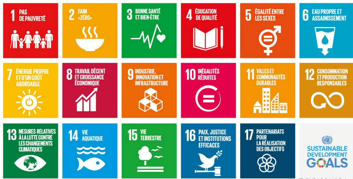
Figure 2: Les 17 Objectifs de Développement Durables de l'ONU